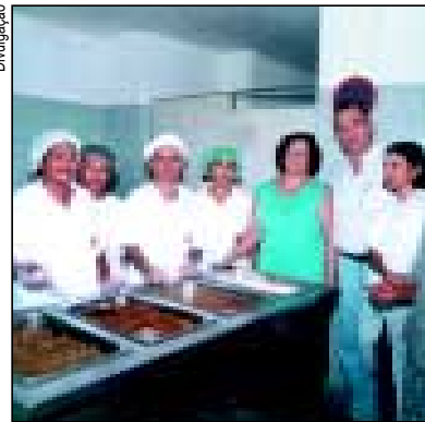
Recife ganha novo restaurante popular

Os trabalhadores de Afogados, um dos bairros mais populares de Recife (PE), estão sendo beneficiados pela Força Sindical. Foi inaugurado em maio o segundo restaurante “Bandeirão do Trabalhador”, que serve, diariamente, 1.200 refeições (almoço, suco e sobremesa). O preço continua o mesmo: R$1 cada.