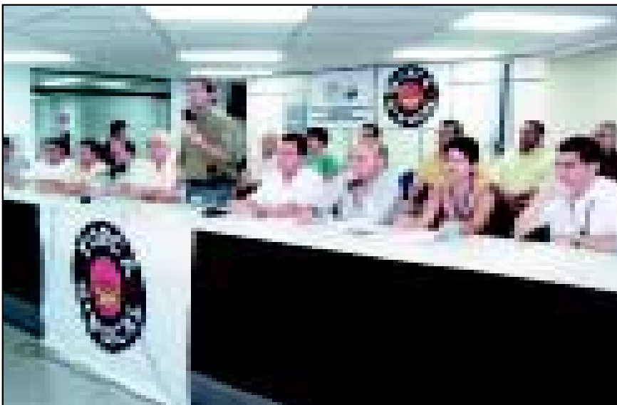
Força Sindical terá 15 dirigentes representando os trabalhadores no FNT