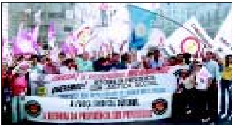
Sindicatistas e militantes foram às ruas exigindo reforma com justiça social

Sindicatos ligados à Força Sindical realizaram em 22 de julho, em São Paulo, manifestação em protesto contra as mudanças no relatório da Reforma da Previdência.