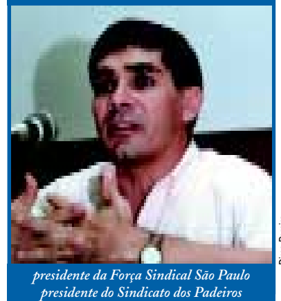
presidente da Força Sindical São Paulo presidente do Sindicato dos Padeiros