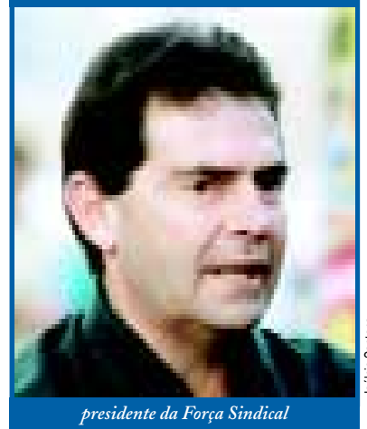
presidente da Força Sindical