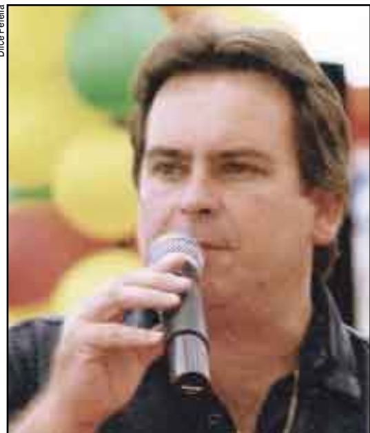
Butka: “Texto foi aprovado após intenso debate”