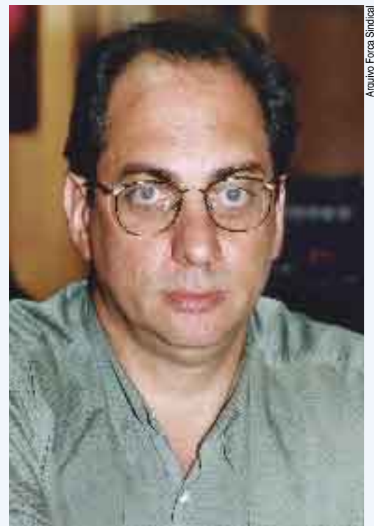
Patah: “Vamos analisar todas as convenções”