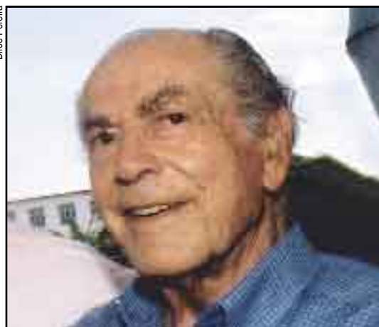
Brizola garantiu a posse de Jango

Com a morte do governador e presidente de honra do PDT, Leonel Brizola, desapareceu um grande líder da política nacional que empolgou multidões durante a campanha da “Legalidade”, em 1961, que garantiu a posse de João Goulart na presidência, depois da renúncia de Jânio Quadros.