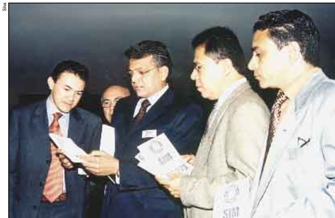
O presidente interino da Força distribui panfletos a favor do mínimo de R$ 275 para os deputados na Câmara

Governo derruba salário mínimo de R$ 275. Trabalhador terá de sobreviver com R$ 260 mensais