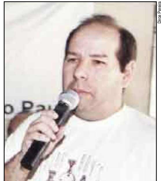
Marques: “Crescimento tem sido fantástico”