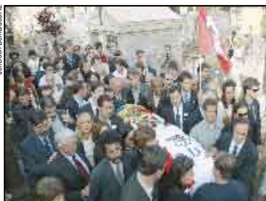
O sepultamento foi em São Borja (RS)