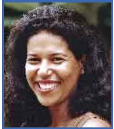
secretária da juventude da Força Sindical