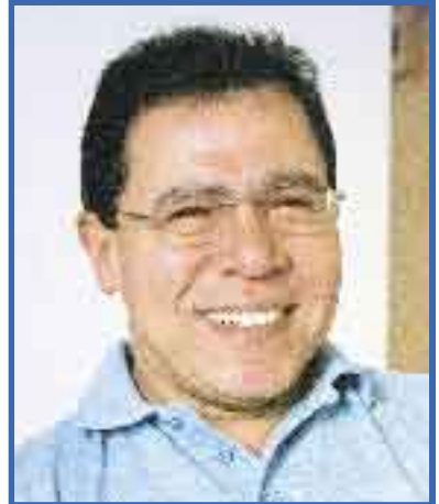
presidente interino da Força Sindical