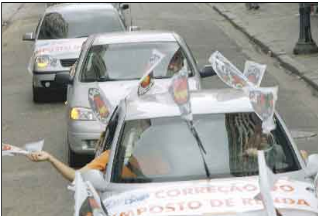
A carreta da Força Sindical foi até o prédio do Ministério da Fazenda em São Paulo

Antes da aplicação do redutor, a tabela do Imposto de Renda acumulava uma defasagem de 55,3% de 1996 até março de 2004, de acordo com a variação do IPCA. Ao manter a tabela congelada em relação à inflação, o Governo aumenta a