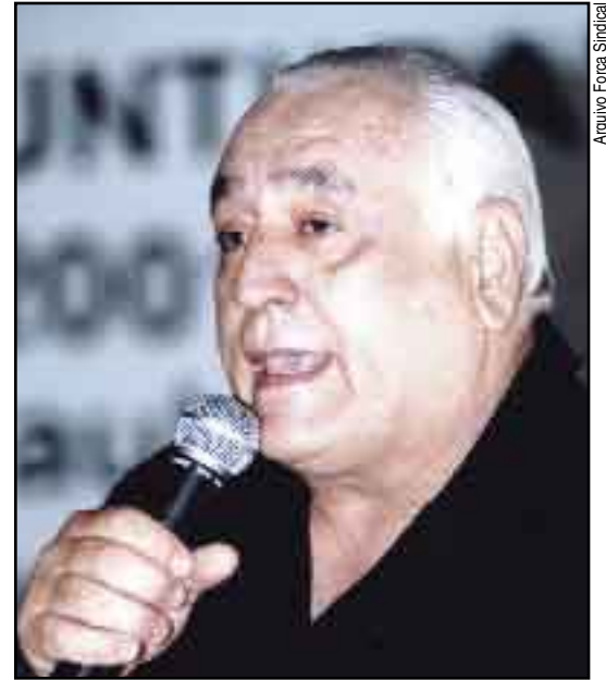
Araújo: “Queremos uma parte dos ganhos”