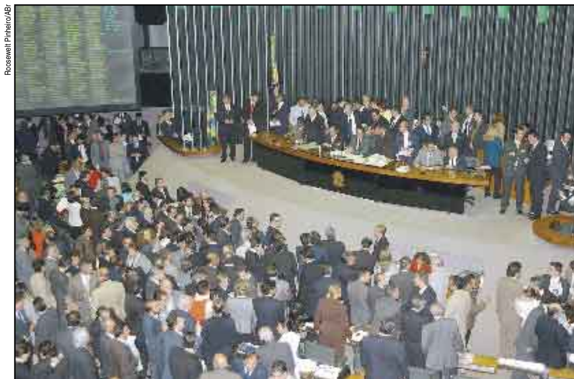
Decepção: foram 272 votos a favor do mínimo de R$ 260 e 172 votos contra

Uma decisão contra a distribuição de renda. O substitutivo que elevava o salário mínimo para R$ 275 foi derrotado na Câmara no último dia 23 de junho, quando houve a votação. Com 272 votos a favor do mínimo de R$ 260, 172 contra e quatro abstenções, o governo recusou a proposta da oposição e aprovou o valor previsto originalmente na medida provisória editada pelo governo federal.