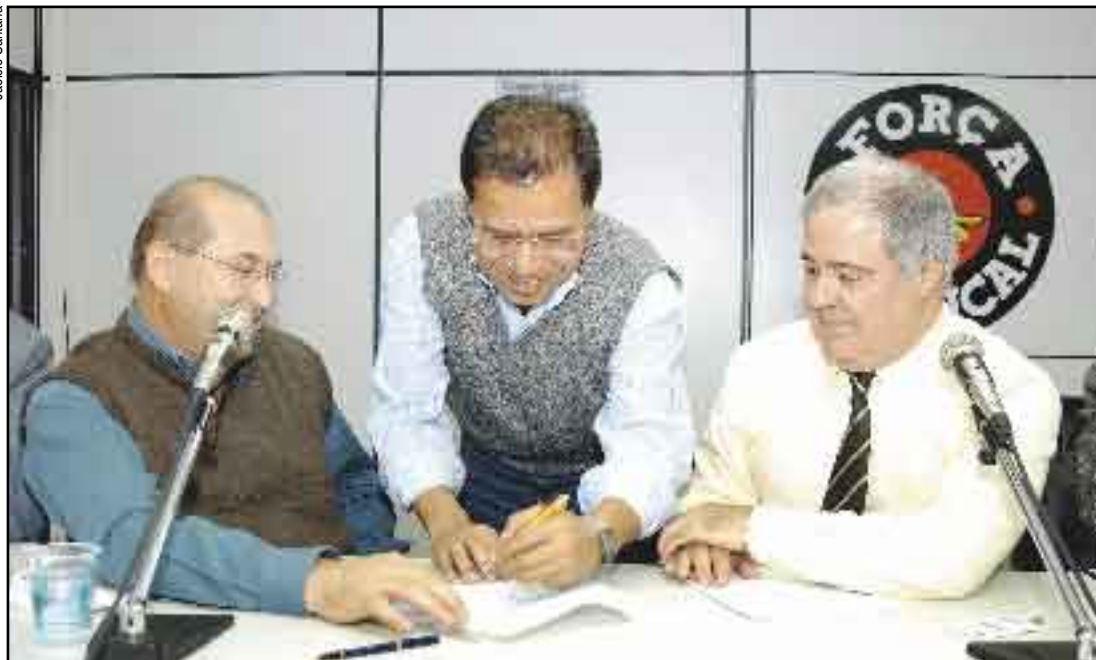
Assinatura de parceria aconteceu no Palácio do Trabalhador, sede da Força Sindical

Metalúrgicos e DRT-SP lançam campanha para acabar com as contratações ilegais