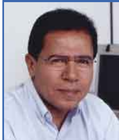
presidente da Força Sindical