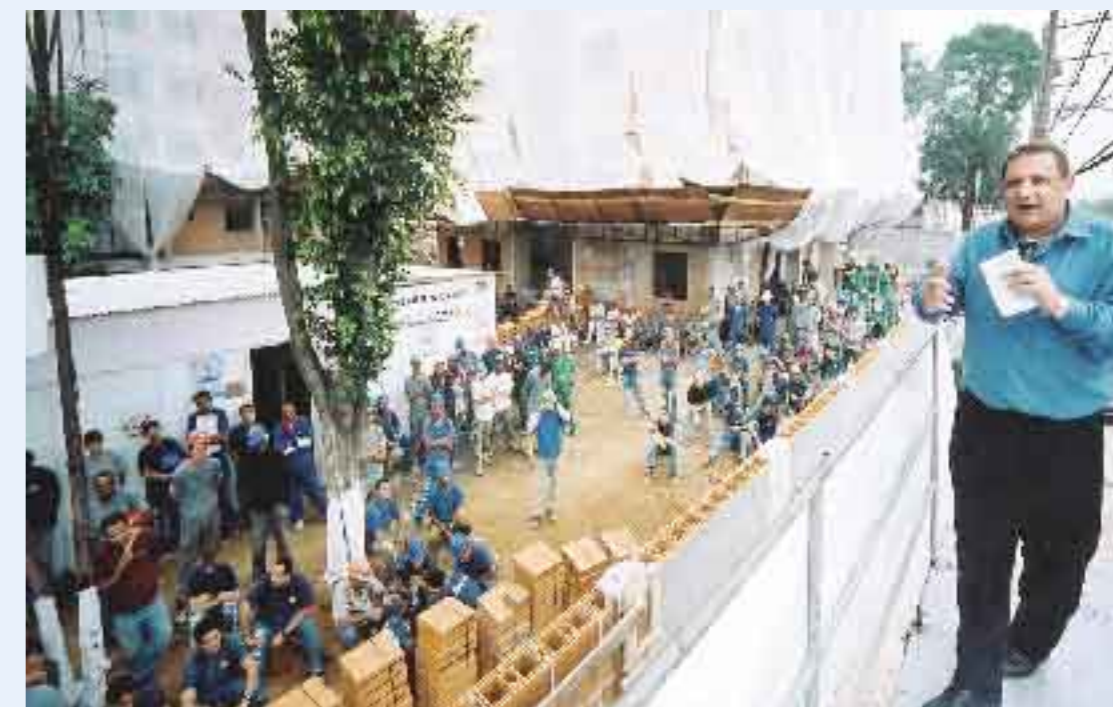
Ramalho discute política com trabalhadores da construção civil

Os dirigentes lembram que a construção civil movimenta toda a economia, pois a criação de um posto de trabalho no setor gera quase quatro novas vagas na cadeia produtiva, que inclui os segmentos metalúrgico, têxtil e costureiras, entre outros. Eles também reivindicam maior ação dos governos federal e estaduais no combate às doenças ocupacionais e aos acidentes.