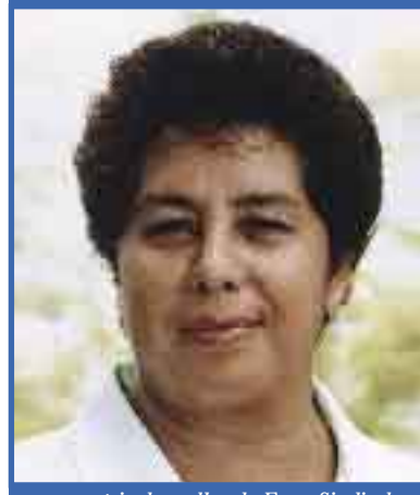
secretária da mulher da Força Sindical