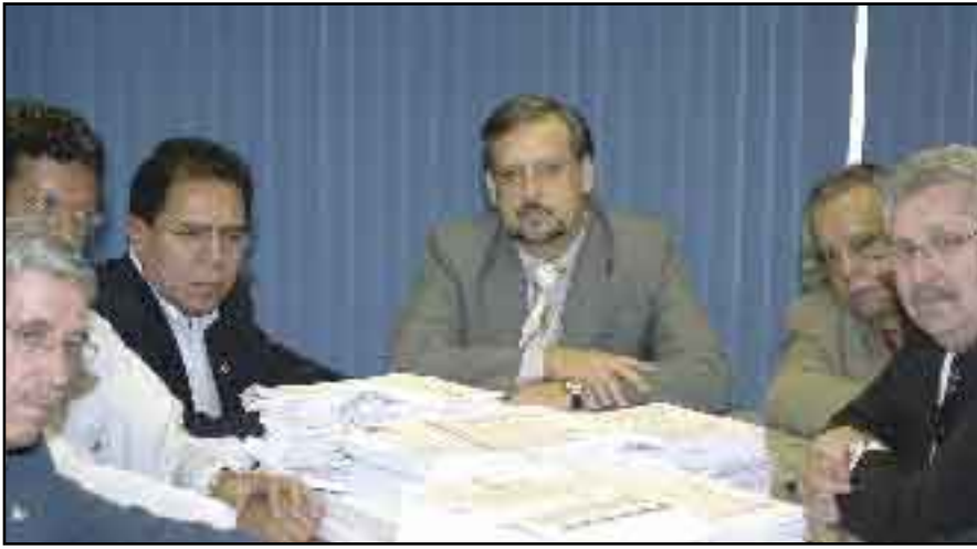
Dirigentes e ministro concordam que patrões ganharam muito