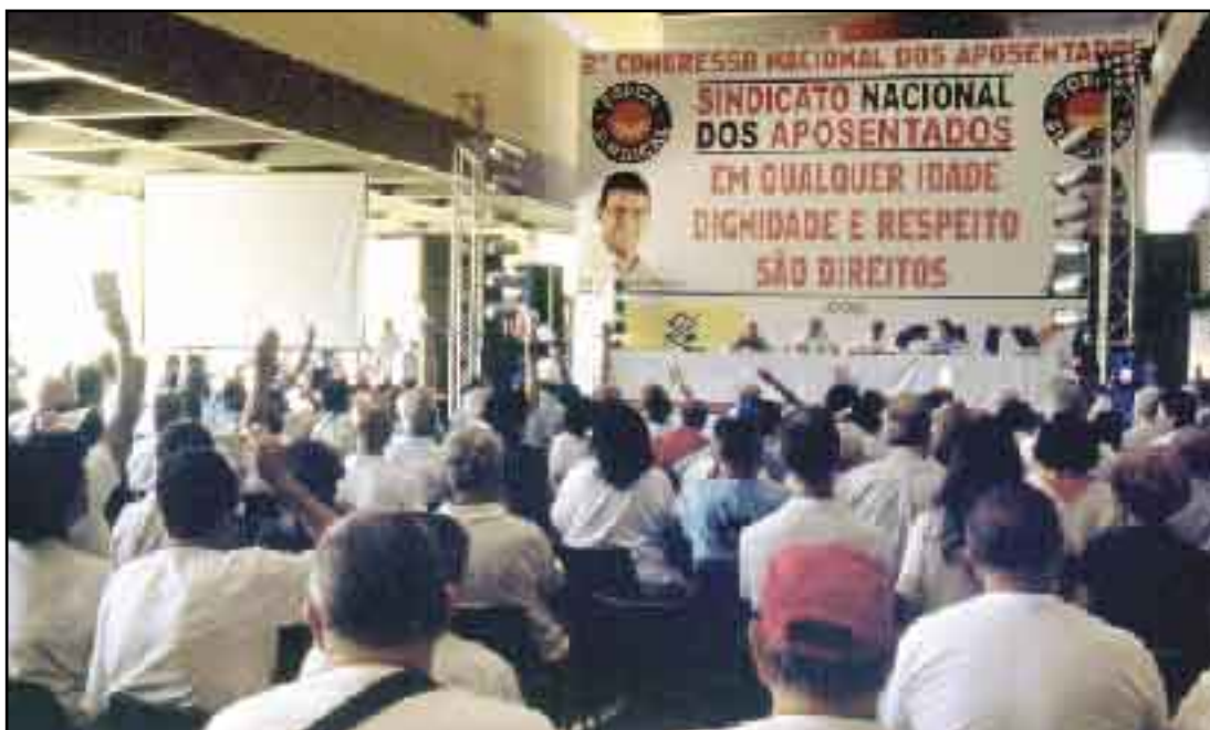
Pelo menos 1.500 delegados das 27 unidades da Federação participaram do evento