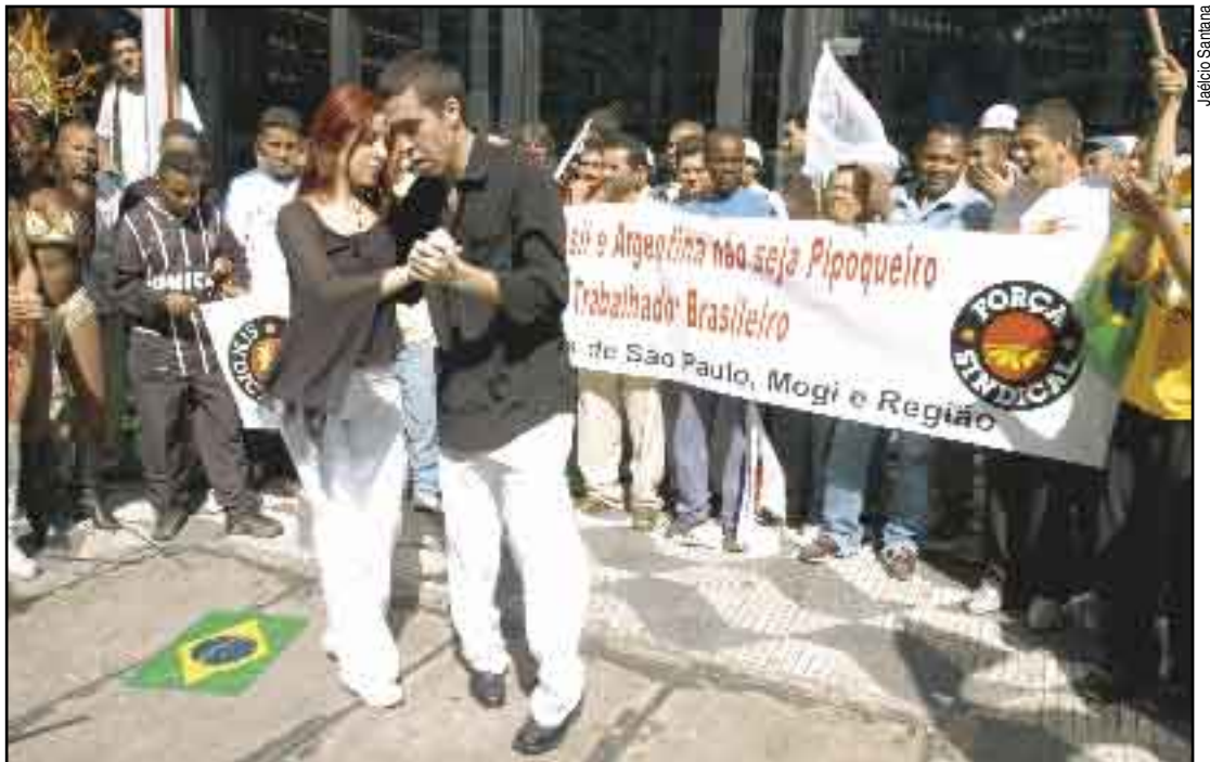
Metalúrgicos da Força fazem protesto bem-humorado na frente do Consulado-Geral Argentino em SP

O governo brasileiro conseguiu apenas ampliar as cotas, mas muitos trabalhadores ainda correm o risco de perder o emprego.