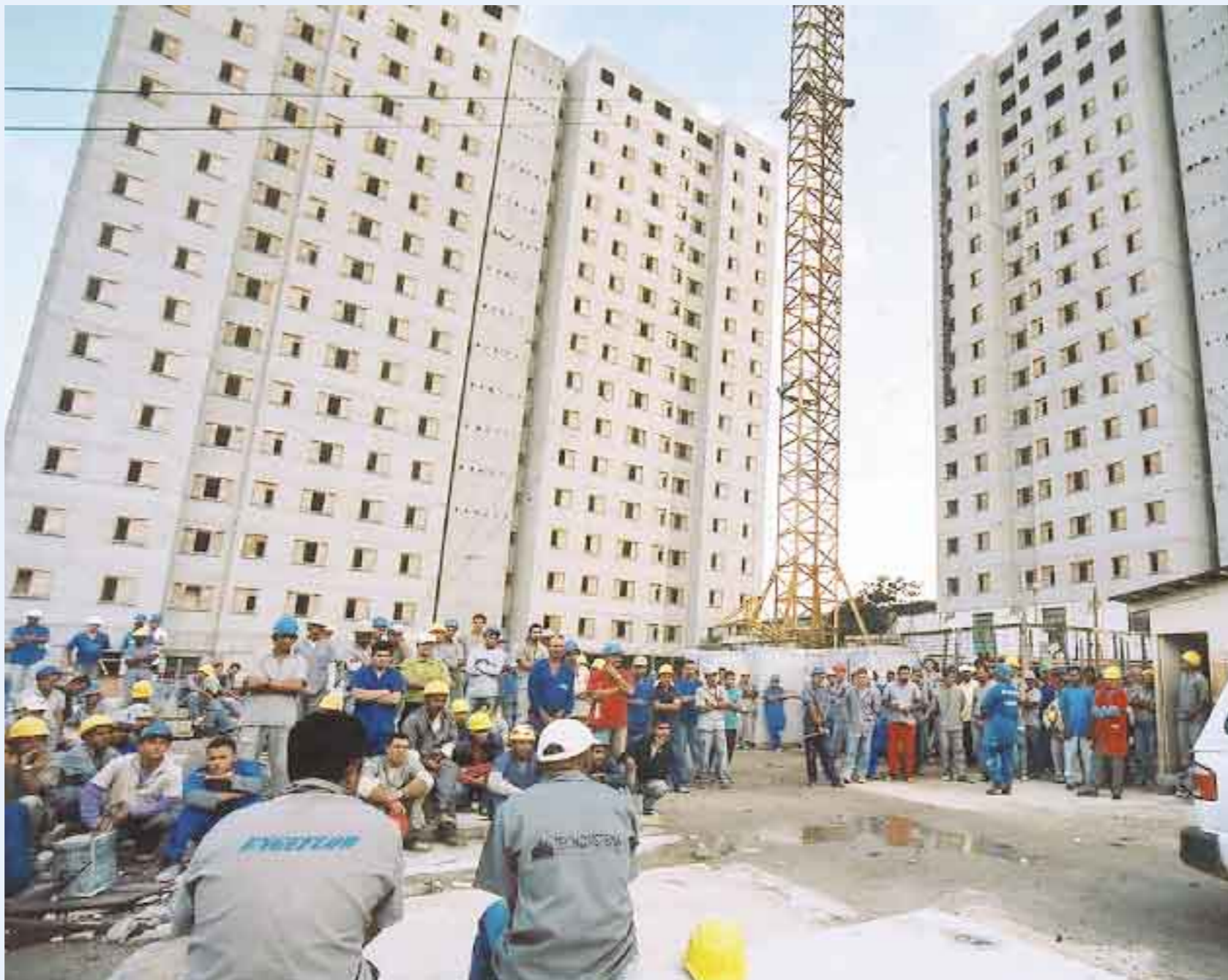
Operários param o trabalho para reivindicar melhores condições de segurança nas obras, aumento de salário e redução da jornada