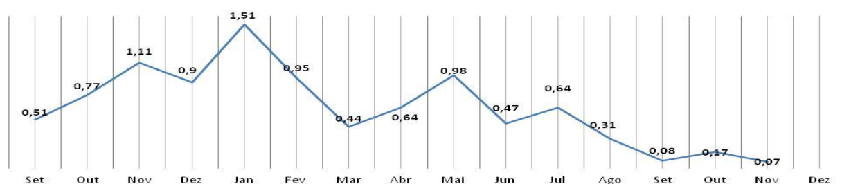
Variação mensal INPC 2015-2016 (%)

. A seguir, a tabela com os resultados INPC por região: